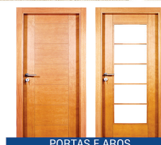
PORTAS E AROS